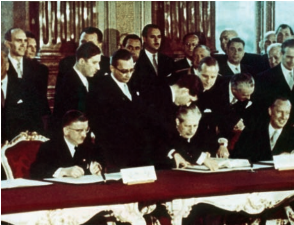
Außenminister Leopold Figl unterzeichnet das schicksalsschwere Vertragswerk als Letzter.