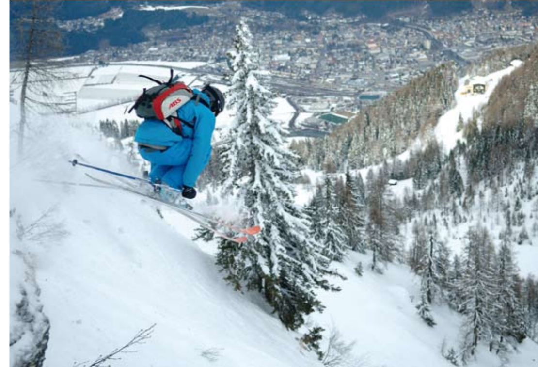
Gut ausgerüstet springt der Freerider Richtung Drautal; unten Spittal/Drau.

Vor der Abfahrt über den Silbergraben, der einen sagenumwobenen Ruf erhalten hat, sei jeder ausdrücklich gewarnt: hier sind vor allem Fähigkeiten als Schispringer gefordert. Als gebranntes Kind bleibt mir nur zu sagen: Nie mehr wieder!!