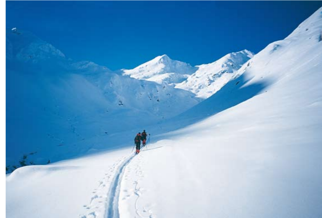
Überaus frostige Temperaturen im Bereich der Melenböden erfordern eine besondere Überwindung für den Gipfelsturm.

fehlt, wird oftmals durch gewaltige Höhenmeterunterschiede, große absolute Gipfelhöhen über 3000 m und den eigenen Spielregeln vergletscherter Zonen egalisiert. So überschreiten beispielsweise drei von vier Schianstiegen auf die Hochalmspitze, wohl das alpine Aushängeschild der Hohen Tauern auf rein Kärntner Boden, deutlich die Hürde von 2000 m Höhenunterschied. Leider ist die Lawinensituation in den Tauern aufgrund der ungünstigen Wetterverhältnisse (Wind, Kälte) signifikant ernster als jene in den Karawanken, Karniern oder Juliern. Ich habe daher hier erstmals versucht eine relative Bewertung der Lawinengefahr zu geben, wenn dies auch ein sehr undankbares Unterfangen ist und nur als grobe Richtlinie für die Tourenplanung herangezogen werden darf. Eigentlich sollten die romantischen Nockberge den geografisch östlichen Ausklang des vorliegenden Schitourenführers bilden. Hier ziehe ich mich mit dem Argument aus der Schlinge, dass „alle“ Nockberge eigentlich von „allen“ Seiten mit Schiern erstiegen werden können, sofern sichere Verhältnisse vorherrschen. Die