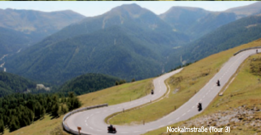
Nockalmstraße (Tour 3)