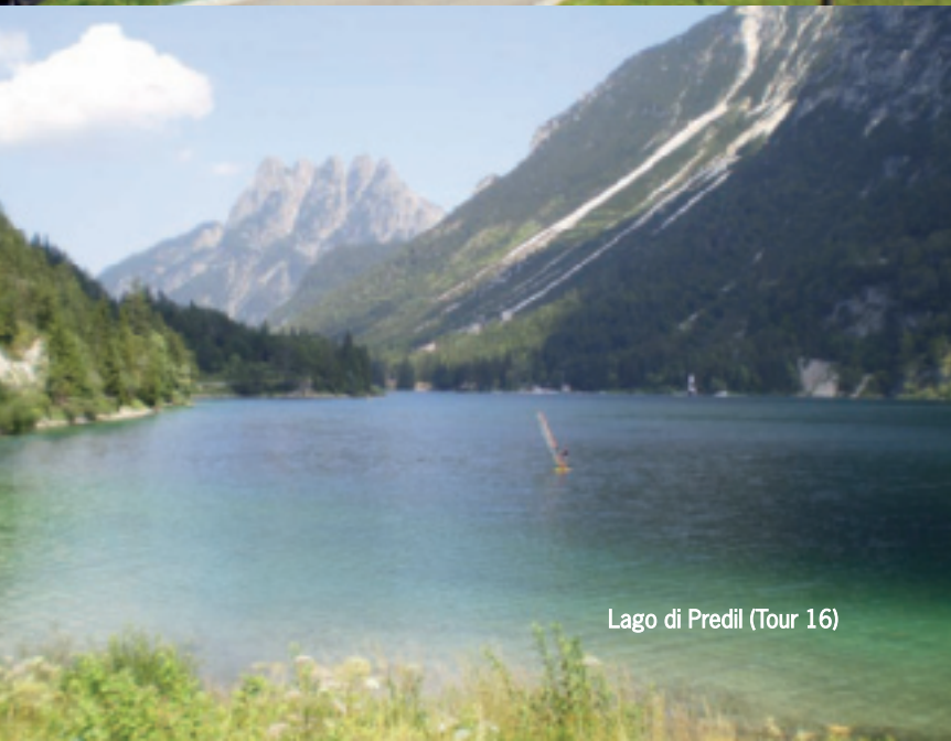
Lago di Predil (Tour 16)