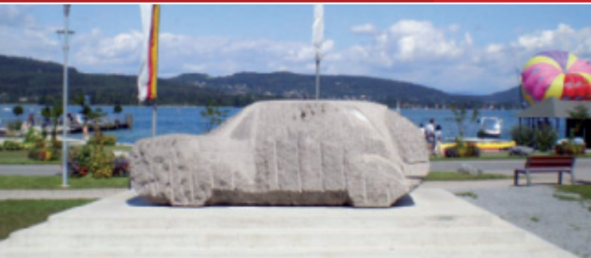
Der steinerne GTI in Reifnitz

Unsere heutige Tour starten wir gleich einmal an der Strandpromenade von Klagenfurt am Wörthersee, der Landeshauptstadt Kärntens. Hier gibt es einige nette Lokale direkt am See, wo man sich am Wasser auf einen Kaffee treffen kann und auch gleich eine der schönsten Stellen von Kärnten sieht, nämlich die Ostbucht des Wörthersees.