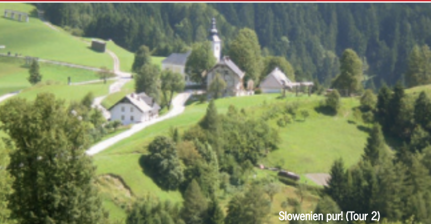
Slowenien pur! (Tour 2)