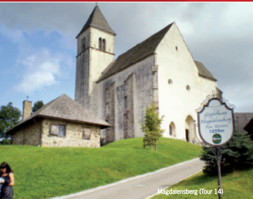
Magdalensberg (Tour 14)