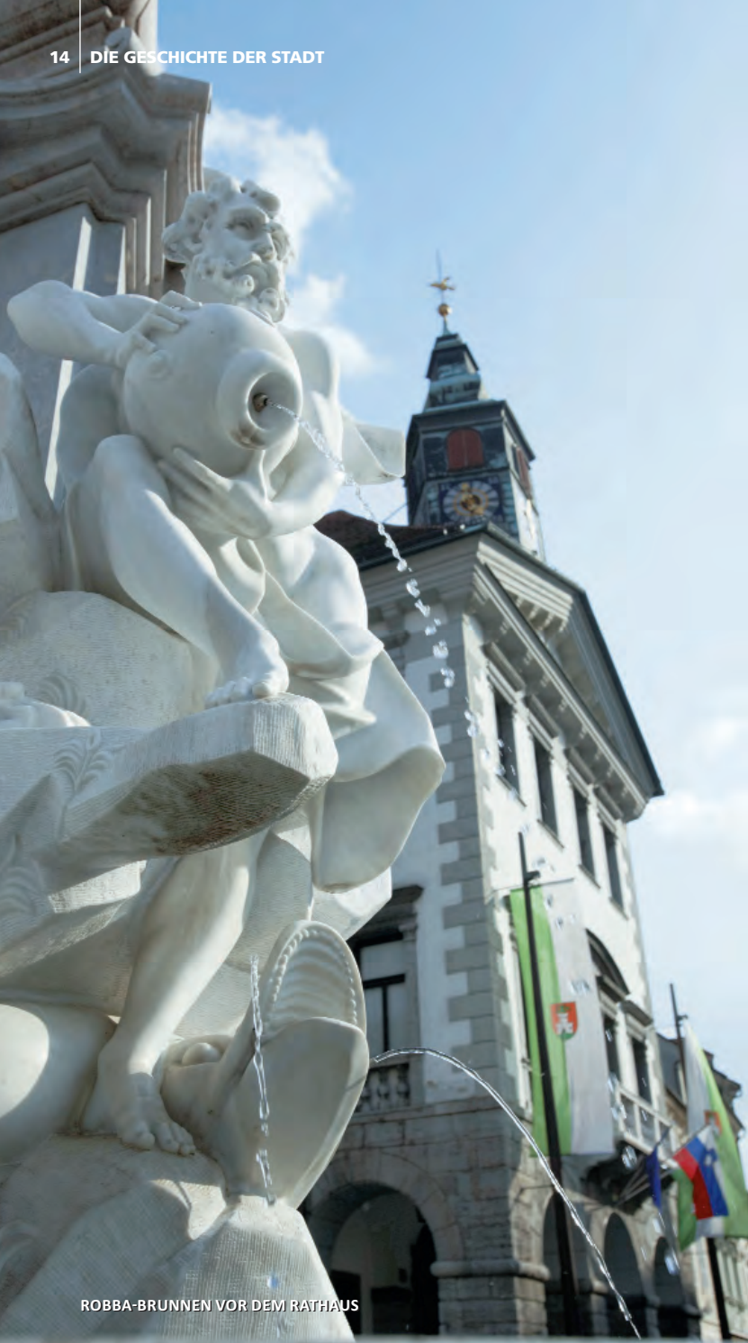
ROBBA-BRUNNEN VOR DEM RATHAUS