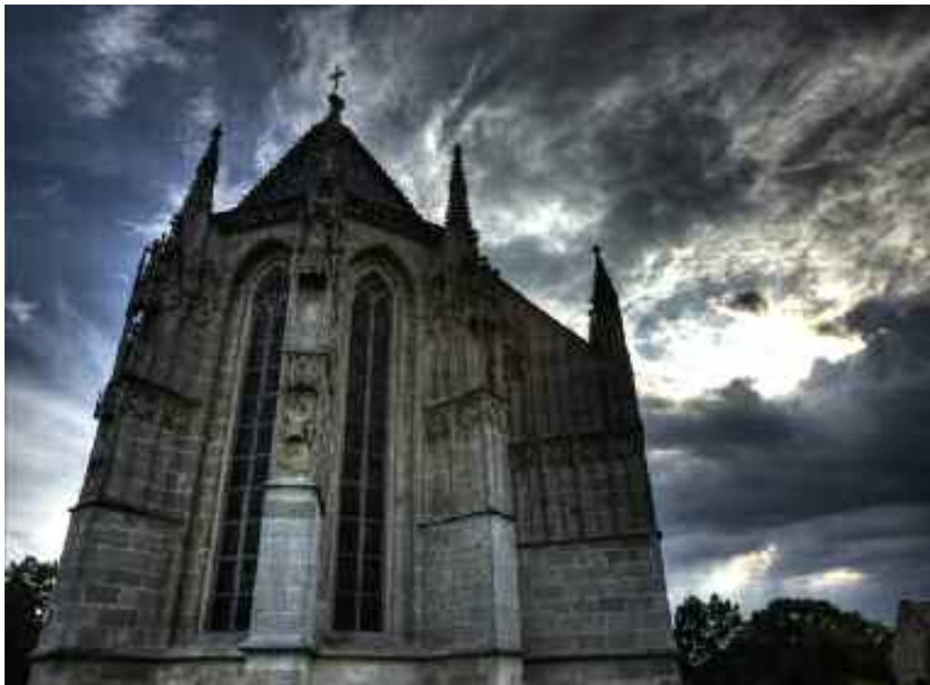
Marienkirche in Bad Deutsch Altenburg. Gleichartige Steinmetz- zeichen in Kirche und Karner von Bad Deutsch Altenburg, Hainburg und Petronell weisen auf eine meister- liche Bauhütte der Templer hin.

lerorden gab“, meint Charpentier. Einige Autoren schließen daraus, dass es außer dem Ordensgroßmeister auch immer ein Pendant, den okkul- ten Großmeister, gegeben habe. Diese Annahme teilte auch die Inqui- sition, die bei den Verhören immer wieder nach der Geheimlehre und dem okkul- ten Auftraggeber der Tempelritter fragte.