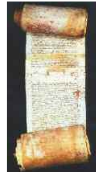
Das „Chinon-Dokument“, die Originalurkunde aus dem Prozess gegen die Tempel.

Dieser Jahrhundertfund der italienischen Historikerin nährt die Hoffnung, in Zukunft noch auf weitere falsch abgelegte oder absichtlich versteckte Inquisitionsdokumente zu stoßen, welche die volle Wahrheit über die Templerprozesse ans Licht bringen könnten.