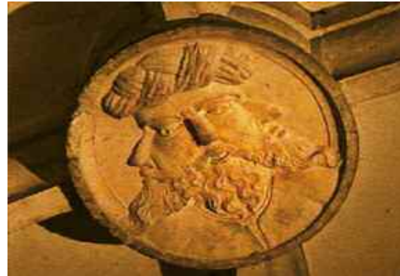
Bild oben: Rätselhafter Gewölbe-Schlussstein: der Baphometkopf der Templerfestung von Tomar in Portugal.

Seit Jahrhunderten rätseln die Forscher, woher der Ausdruck „Baphomet“ stammt und was damit gemeint war. Zur Wortdeutung wurde die