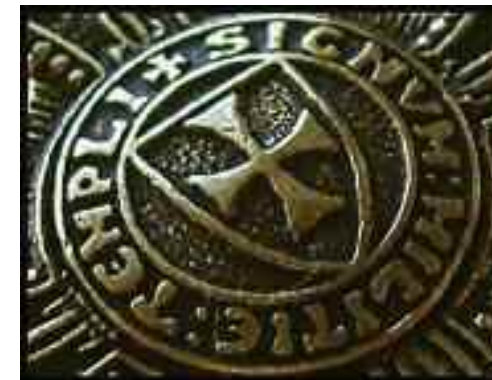
Der Siegelring eines Templers.