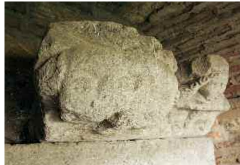
Bild unten: Der steinerne Dreifachkopf von Kronberg – ein Baphomet-Antlitz?

Kabbala, die Summe der jüdischen Weisheitslehren, herangezogen. Es könnte sich bei dem Wort „Baphomet“ um ein nach der kabbalistischen Methode chiffriertes Wort für „Weisheit“ handeln. Im Hebräischen gibt es eine Methode, Texte zu verschlüsseln, die man „Atbash“ nennt. Danach nimmt man die ersten elf Buchstaben des 22 Buchstaben umfassenden hebräischen Alphabets und schreibt sie in eine Reihe. Darunter schreibt man die übrigen elf Buchstaben, beginnend mit dem letzten. Liest man nun von links oben nach unten die Buchstaben der ersten senkrechten Spalte und dann die zweite, so erhält man das Wort ATBASH. Zum Verschlüsseln bzw. Entschlüsseln vertauscht man die Buchstaben gegeneinander.