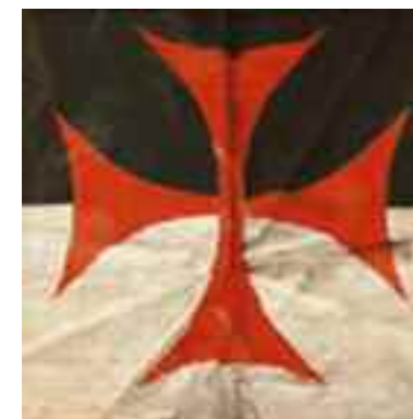
Das Zeichen der Templer: Bild links: Templerrüstung mit dem roten Tatzenkreuz.