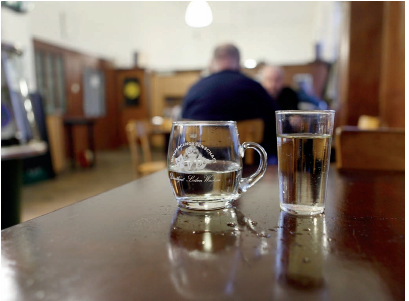
Spritzer- und Achtelgläser, die es eigentlich gar nicht mehr gibt. Beim Blauensteiner aber gibt es sie ...