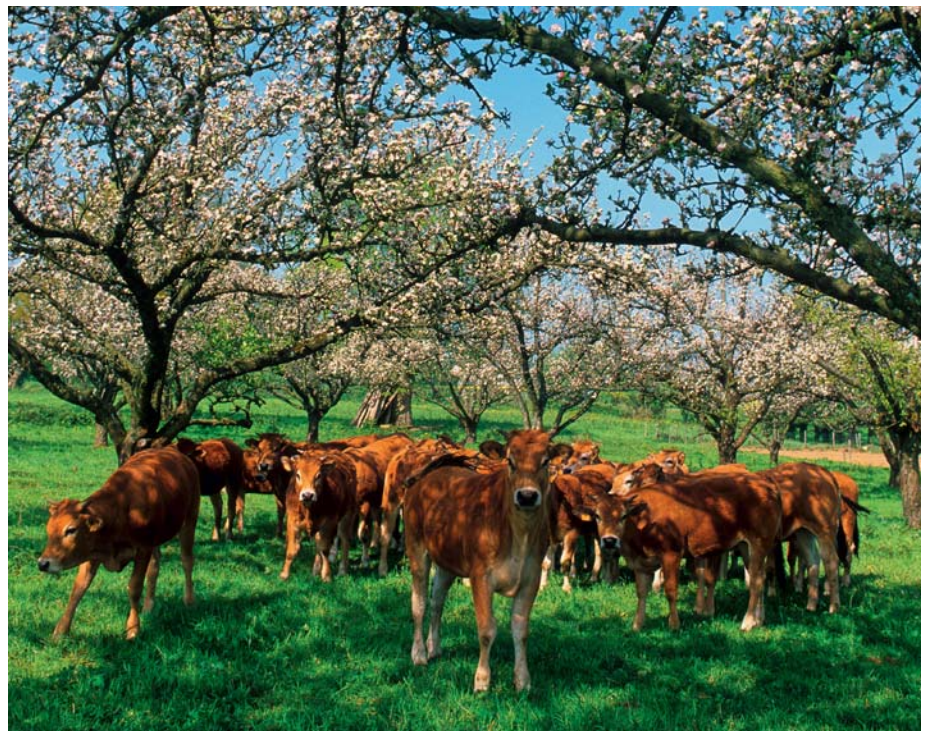
Das Anjou: Wiesen und Wälder, ab und zu kleine Hügel, unberührte Natur.

Auch wenn die Ziegen die Landschaft beherrschen, sollte der Kuhmilchkäse aus dem Herzen Frankreichs keinesfalls unerwähnt bleiben. In dem gewaltigen Becken, das die Loire mit ihren Nebenflüssen formt, gibt es exzellenten Kuhmilchkäse. Als Beweis dienen die drei traditionellen Käse. In Loiret findet man an den Ufern der Loire den Weichkäse Olivet , dessen Teig weder erhitzt noch gepresst wird. Der in einen Aschemantel gehüllte Käse wird meist auf Stroh in Spanschachteln gelagert, was ihm nach einer langsamen Reifung einen ganz speziellen Geschmack und einen leichten Schimmelgeruch verleiht, der mit zunehmendem Alter intensiver wird. Ein wenig milder und mittlerweile das ganze Jahr über erhältlich ist der Pithiviers . Bis vor kurzem wurde der Weich-