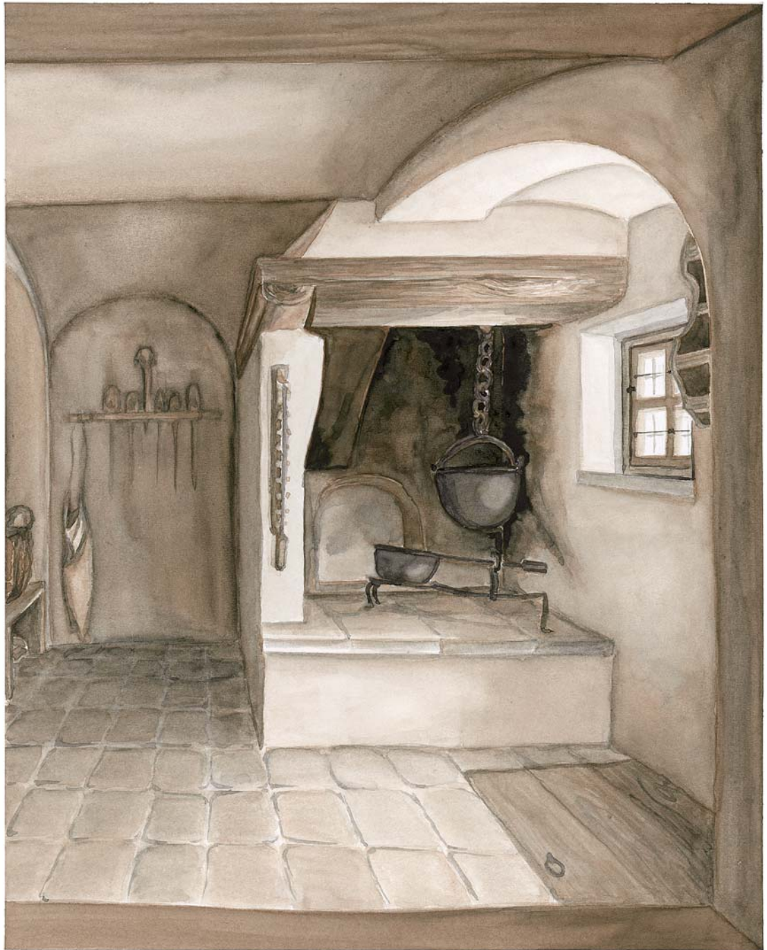
Küche für die Austragler, Michlhof/Tyrlaching bei Burghausen, Oberbayern (18. Jh.)